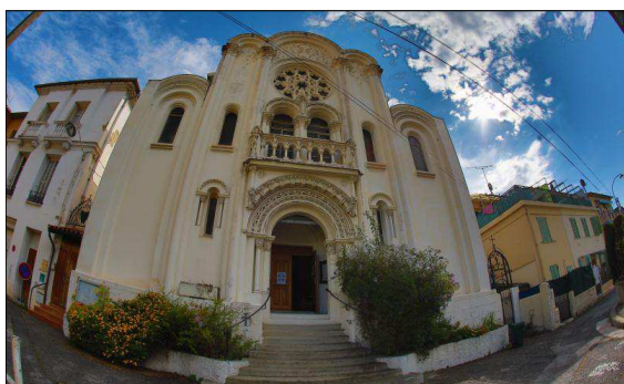
L'église Sainte-Thérèse, quartier Magnan à Nice.